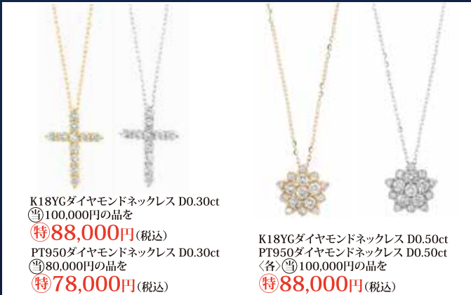
K18YGダイヤモンドネックレス D0.30ct 特88,000円 (税込) PT950ダイヤモンドネックレス D0.30ct 特78,000円 (税込)