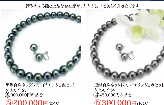
深みのある艶と上品な存在感が、大人の装いを美しく引き立てます。 黒蝶真珠ネックレス・イヤリング2点セット クラス:SV 特200,000円 (税込) 黒蝶真珠ネックレス・イヤリング2点セット クラス:SV 特300,000円 (税込)