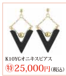
K10YGオニキスピアス 特25,000円 (税込)