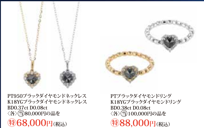
PT950ブラックダイヤモンドネックレス K18YGブラックダイヤモンドネックレス BD0.37ct D0.08ct 〈各〉 特68,000円 (税込)