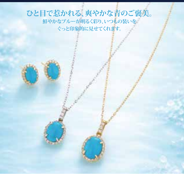
K18YGトルコ石ピアス T0.82ctup D0.12ct PT950トルコ石ネックレス T0.82ctup D0.07ct K18YGトルコ石ネックレス T0.79ctup D0.07ct 〈各〉 特58,000円 (税込)

ひと目で惹かれる、爽やかな青のご褒美。 鮮やかなブルーが明るく彩り、いつもの装いを ぐっと印象的に見せてくれます。