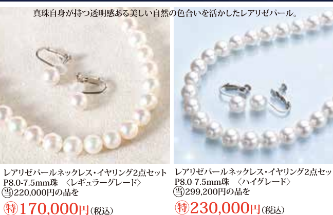
真珠自身が持つ透明感ある美しい自然の色合いを活かしたレアリゼパール。 レアリゼパールネックレス・イヤリング2点セット P8.0-7.5mm珠 〈レギュラーグレード〉 特170,000円 (税込) レアリゼパールネックレス・イヤリング2点セット P8.0-7.5mm珠 〈ハイグレード〉 特230,000円 (税込)