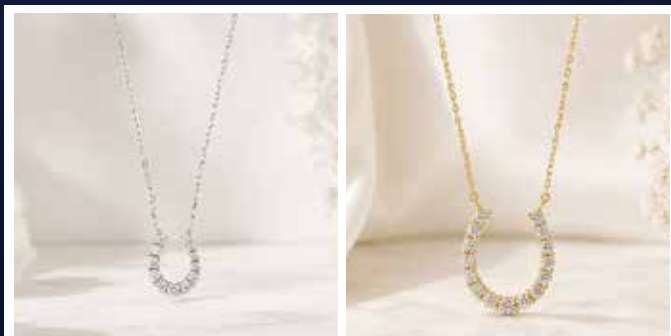
PT950ダイヤモンドネックレス D0.10ct 特45,000円 (税込)