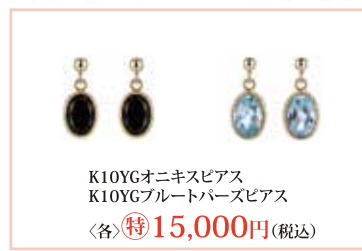
K10YGオニキスピアス K10YGブルートパーズピアス 〈各〉 特15,000円 (税込)