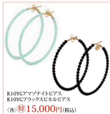
K10YGアマゾナイトピアス K10YGブラックスピネルピアス 〈各〉 特15,000円 (税込)