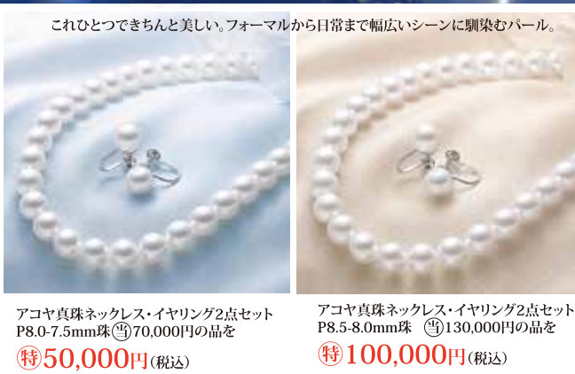
これひとつできちんと美しい。フォーマルから日常まで幅広いシーンに馴染むパール。 アコヤ真珠ネックレス・イヤリング2点セット P8.0-7.5mm珠 特50,000円 (税込) アコヤ真珠ネックレス・イヤリング2点セット P8.5-8.0mm珠 特100,000円 (税込)