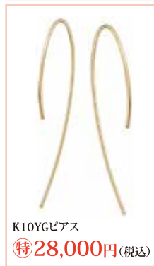
K10YGピアス 特28,000円 (税込)